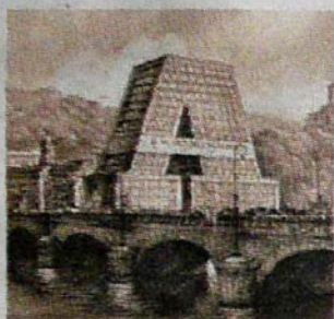
La lettera «A» dell'alfabeto torinese di Gregory Hill

La «A» di Gregory Hill è un'enorme porta in muratura costruita sul ponte Vittorio Emanuele I. Gloria Soriani ha creato un alfabeto pop, coloratissimo e sinuoso. Quello di Arsmeteo-Easybit è suggerito da ombre, particolari, cavi tesi in una sequenza di foto catturate in città e fuori. Lemani di Ciriè infine ha «costruito» le sue lettere, enormi caratteri che fungono pure da mobili. Sono loro i vincitori del concorso «Europa dall'alfabeto mai comune», un progetto del Caus, Centro di arti umoristiche e satiriche animato dall'instancabile Raffaele Palma: nel suo ambito, si inaugura oggi nella Sala Viglione di Palazzo Lascaris una mostra fotografica dedicata alle lettere e ai numeri che si possono «rubare» a una città. (l.biz.)