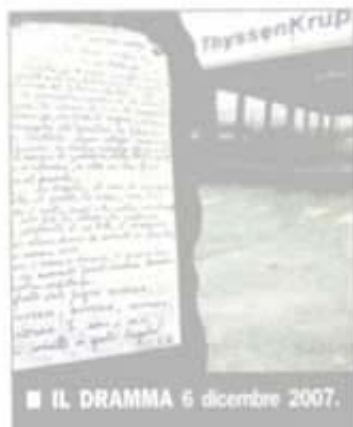
■ IL DRAMMA 6 dicembre 2007.

organizzate una mostra fotografica e un'opera video sulla tragedia Thyssen, grazie alla raccolta di materiali da fotografi professionisti, foto-amatori, familiari, colleghi di lavoro, amici e cittadini comuni. Settantacinque opere verranno